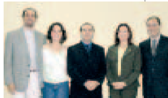
EQUIPE DA DELEGACIA DO CRBM 3ª REGIÃO - TOCANTINS: ESCOLHA DE TEMAS MULTI E TRANSDISCIPLINARES

“Apesar do pequeno número, temos que nos fazer representar pela qualidade nas atividades que desenvolvemos em todas as áreas as quais estamos inseridos. Eventos como este vem corroborar para a melhoria profissional, não somente técnica como também ética, pois evidencia que somos parcela importante de uma sociedade que